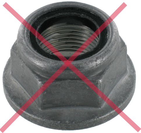
Diseño antiguo de tuerca